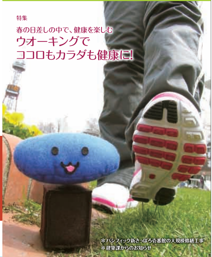
*パシフィック新さっぽろ番館の大規模修繕工事 *建築課からのお知らせ